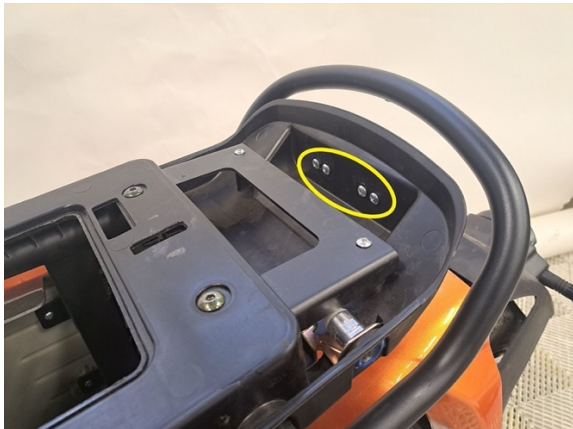
Irrota takaheijastimen kiinnitysruuvit. (ristipäämeisseli ph2).