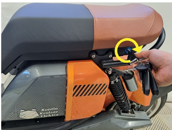
Avaa penkin lukitus avaimella.